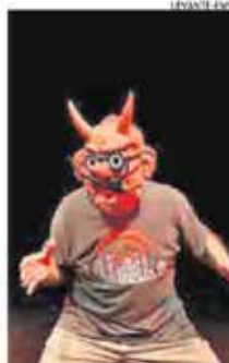
Una escena de Fobra.

Font fa un monòleg creïble ajudat per aquelles carretes que caracteritzen el seu grup, amb ajuda d'alguna projecció, música i fins i tot un mínim artefacte pirotècnic. I fum, molt de fum,